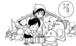
災害時の被災地支援のために