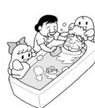
高齢者が安心して暮らせる地域づくりのために