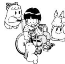
障がいをもつ方の社会自立のために