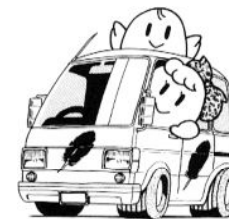
車椅子ごと乗れる自動車の購入に