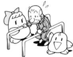
ボランティアの育成活動支援のために