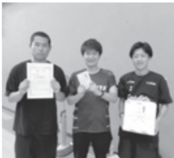
優勝『士別翔雲A』の皆さま