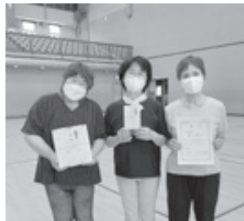
準優勝『楽しみ隊』の皆さま