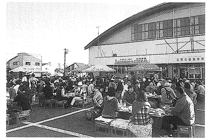
△ 毎年7月に開催されている、ふれあい広場 △