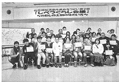
住民福祉活動を進めるつどい