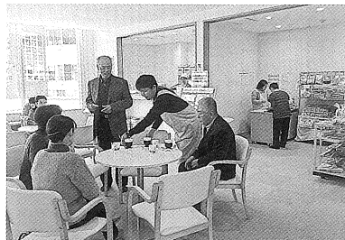
福祉の店シュペツ