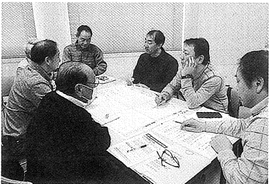
災害に強い地域づくり研修会