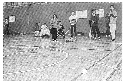
市民ボランティアスクール