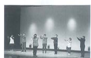
士別愛成会 るんべる