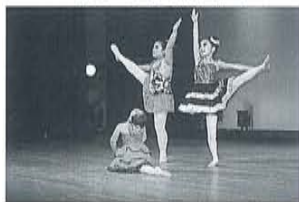
ユキモダン & ジャズパレエ士別教室