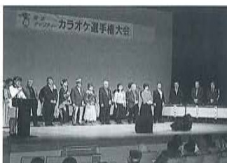
出場者のみなさま