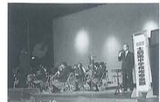
士別南中学校吹奏楽部