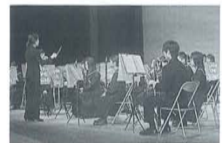
士別中学校吹奏楽部