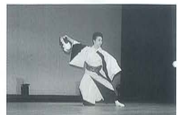
日本現代舞踊徳本流 すずらん会様の演舞