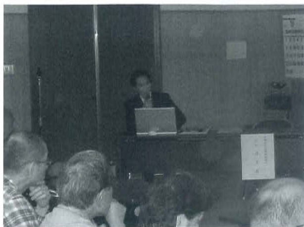
士別地域成年後見センター 寺口主任相談員