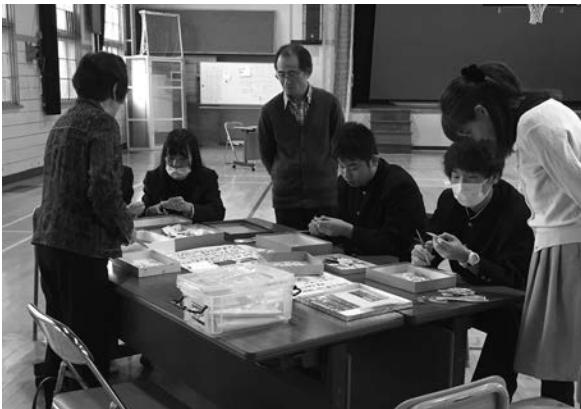
「ボランティアって何だろう？」士別東高校 士別手話サークル、士別要約筆記サークルなのはな、 収集ボランティアサークルひまわり