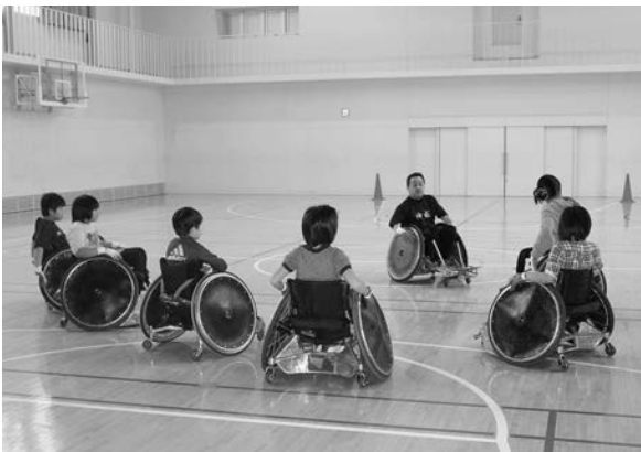
「障がい者スポーツを楽しもう」糸魚小学校 ウィルチェアラグビーチーム神威