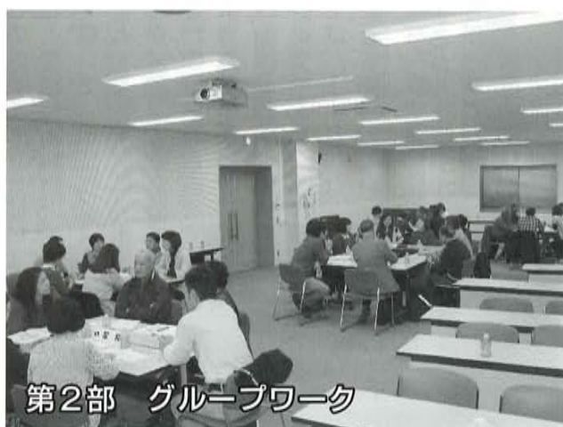
第2部 グループワーク