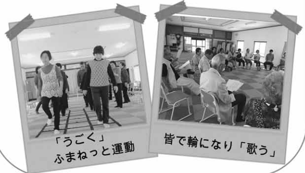
「うごく」 ふまねっと運動