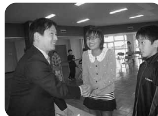
「夢追いかけて」士別南小学校 パラリンピックメダリスト 河合純一氏