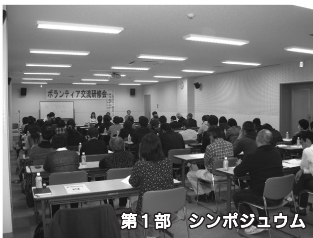
第1部 シンポジウム