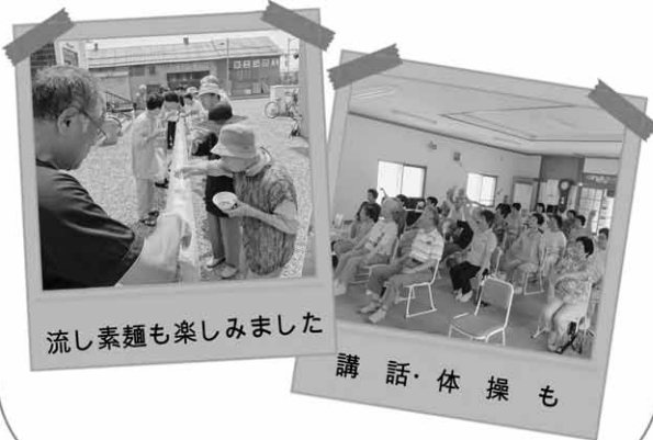
流し素麺も楽しみました