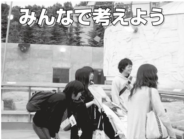
ふれあい広場でさぼてん企画ビンゴ大会