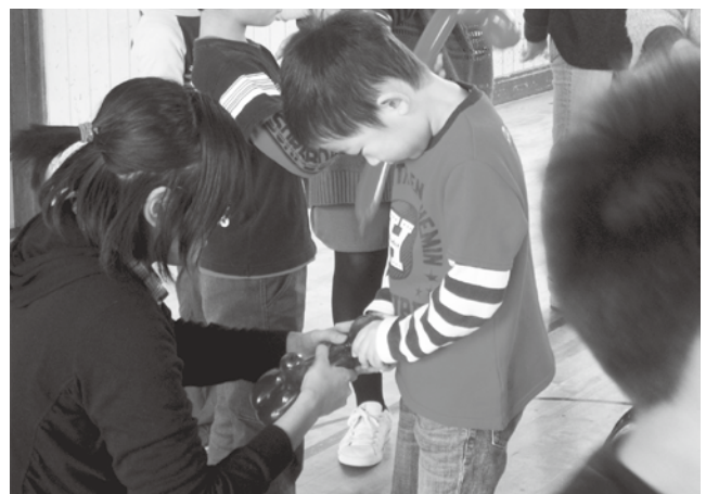
バルーンアートで児童館児童との交流