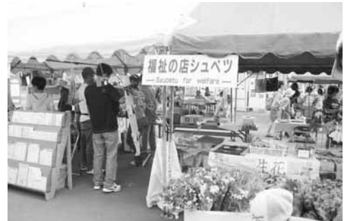
福祉の店シュベツ

焼きそば・フランクフルト・ジュースなどの飲食コーナー、衣類、工芸品などの作品販売コーナーにたくさんの方が集まっていました。学童生徒ボランティアのみなさんも頑張ってお手伝いをしていました。