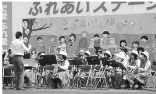
士別南中学校吹奏楽部

ステージでは合唱・鼓笛・一輪車・チャリディング・吹奏楽、ふれあいの夕べでは、よさこいソーラン・フラダンスなど多くの人たちが素晴らしい演奏と演技を見せてくれました。