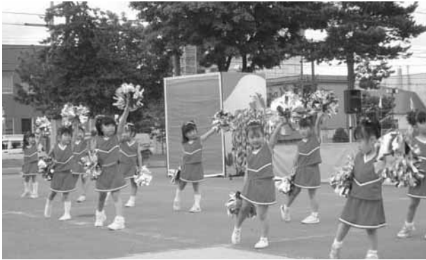
“ジュニアチアリーディングクラブ”

士別市東5条3丁目 サポートセンターしべつ内 社会福祉法人 士別市社会福祉協議会(TEL22-3012) http://www.shibetsu-shakyo.jp/