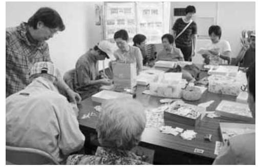
使用済み切手整理

点字で名刺作り・切手の整理・車椅子・盲導犬についての講話と体験など、みんな楽しそうに体験していました。