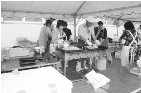
焼きそばコーナー