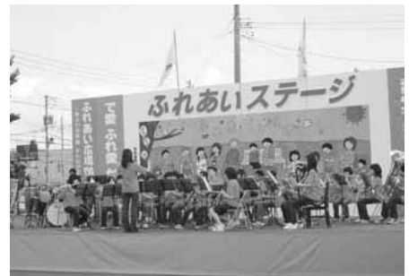
士別中学校吹奏楽部