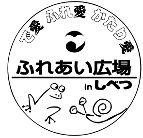
ふれあい広場シンボルマーク

開催日：平成21年7月4日～7月5日 開催場所：士別市総合体育館アリーナ・駐車場 主催：社会福祉法人士別市社会福祉協議会 運営主体：ふれあい広場 '09inしべつ PART26 実行委員会 共催：士別市 後援：士別市教育委員会、北海道共同募金会士別市支会