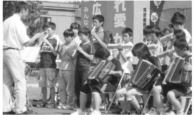
士別西小学校6年生