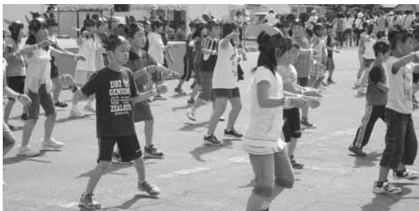
士別南小学校3年生