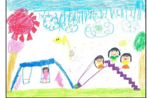
テーマ ともだちといっしょに こうえんで あそんでる えをかきました