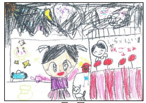
テーマ おかあさんといっしょに おまつりにいった