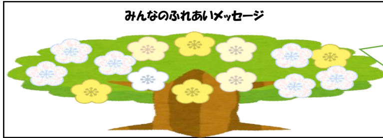
みんなのふれあいメッセージ

新型コロナウイルスが広まり「できなくなったこと」がたくさんある現在…。 前向きな気持ちになれるような「コロナが収まったらこれをやりたい！」 というメッセージを募集します！カードは下記のように掲示予定です！