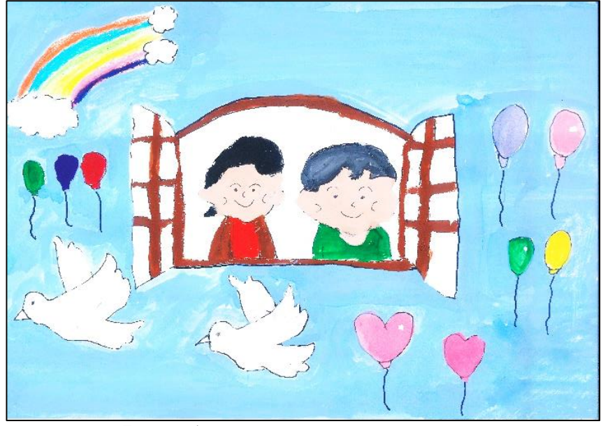
テーマ 「ほのぼのとした絵」をイメージしました