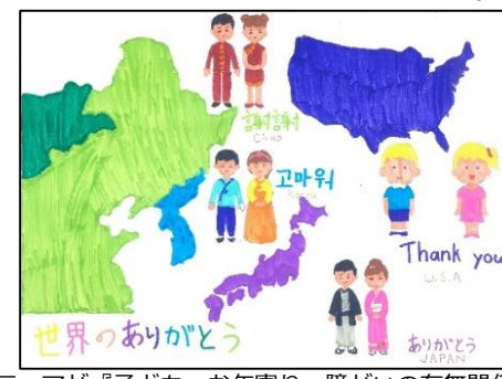
テーマが『子ども、お年寄り、障がいの有無関係なくみんなが触れあう広場』だったので、全体的に『差別をなくす』ようなことかなと思ひ、差別といえども一つ、人種差別があるなと思つたので、世界をテーマに書きました。差別は何をしつたらなくなるかなと考へたところ、感謝の気持ち(言葉)が最重要だと思つたので、世界各地のありがとうをかきました。工夫した点は何の国の人かわかりやすくするため、その国の伝統のある服を書きました

全部で35点の応募がありました。 応募していただいたみなさん どうもありがとうございました! 「ふれあいの絵」は、すべての応募作品を 社協ホームページからご覧いただけます!