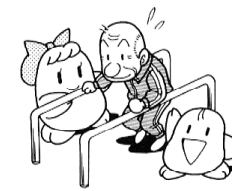
お年寄りや障がい者のリハビリに