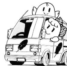
車椅子ごと乗れる自動車の購入に