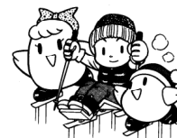
障害者のスポーツ用具に (絵はチェアスキー)