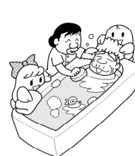
寝たきりのお年寄りの入浴サービスに