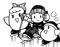
障害者のスポーツ用具に (絵はチェアスキー)