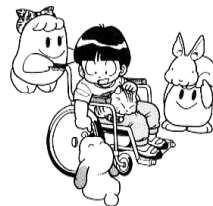
障がい者の車椅子に