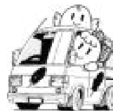
車椅子ごと乗れる 自動車の購入に