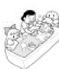
寝たきりのお年寄りの入浴 サービスに