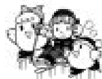
障害者のスポーツ用具に (絵はチェアスキー)